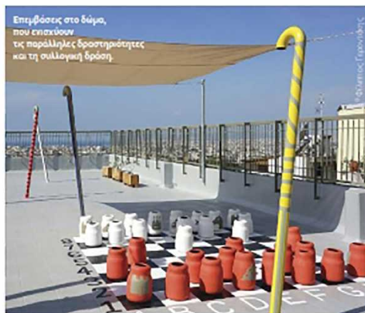
Επεμβάσεις στο δάμα, που επισκιάουν τις παράλληλες δραστηριότητες και τη συλλογική δράση.

ματα, καθώς και η απαίτηση τοποθέτησης εξεραστήρων για την απομάκρυνση υδρατμών που πιθανών να είναι εγκλωβιστεί κάτω από την μόνωση οδηγούν στη δημιουργία σημασιώ κατασκευών με σωλήνες καλώστια που εφορρίζουν ένα μειωμένο πεδίο γρήγορης κίνησης και ενεργοποιούν τη δημιουργικότητα και την εφευρετικότητα των παιδιών. Τα φθινητά πανιά σκόσης αρχίζουν σαρώς τις ζώνες στάσης και σε συνδυασμό με τα ξύλινα γραμμικά καθίστα διαμορφώνουν ευέλικτους χώρους υποδοχής υπαίθριας διδασκαλίας. Η φύτευση αποτελεί βασικό στοιχείο της αισθητικής αναβάθμισης