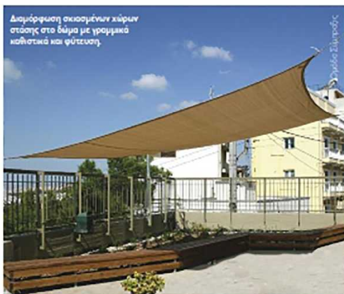
Διαμόρφωση σκιασμένων χώρων στάσης στο δάμα με γραμμικά καθίστα και φύτευση.