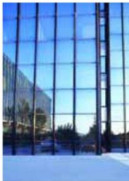
Εξώφυλλο: Κτίριο γραφείων